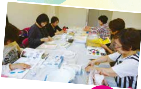
同窓会活動 「しおん」

令和6年度 公開講座のご案内 じんたん公式SNSで情報発信しています！ 社会人選抜 / 再就職の情報提供