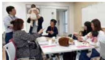
幼教ホームカミングデー お申込みはQRから

当日は、仁短祭も同時開催しています!こども向け企画「じんあいこどものくに」にも、ぜひお子さんと一緒にご参加ください。