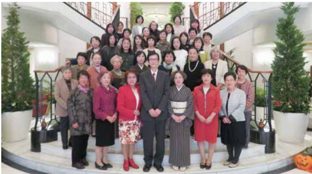
昨年度、総会での記念撮影(会場はホテル日航プリンセス京都にて)