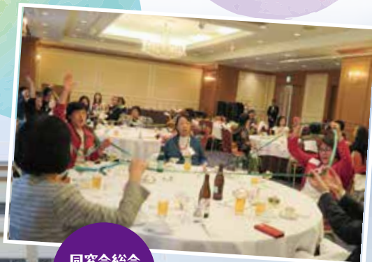
同窓会総会 「レクリエーション」