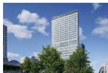
コートヤード・バイ・マリオット福井 JR福井駅西口から徒歩2分

参加費を指定の口座に事前にお振り込みいただきますようお願いいたします。振込手数料はご負担ください。参加費のお振込みを確認後、受付完了となります。受付が完了しましたら、申し込み締め切り(10月20日)以降に、受付完了と詳細のハガキをお送りしますので、当日受付までお持ちください。