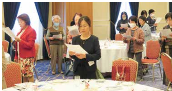
【学歌「ねがい」を斉唱】